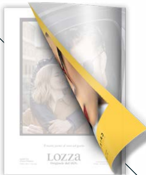
III di copertina BR 4