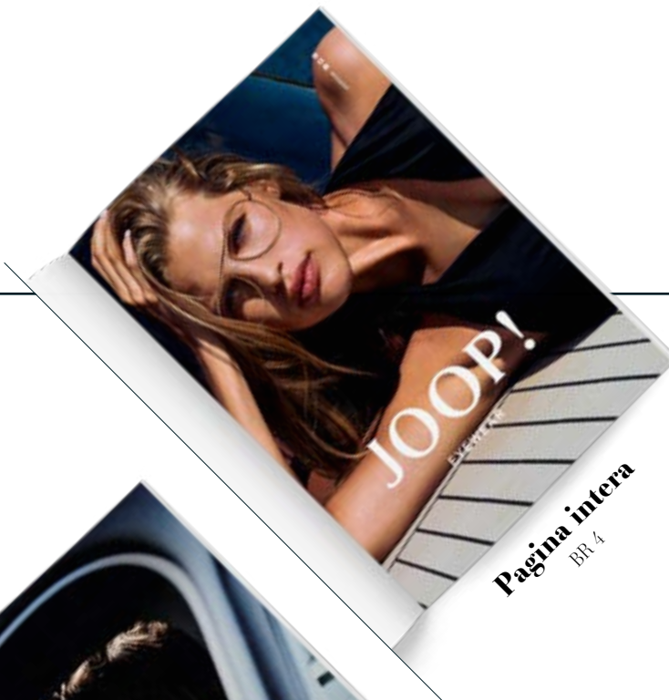
Pagina intera BR 4