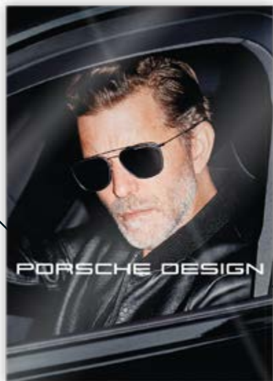
IV di copertina BR 4