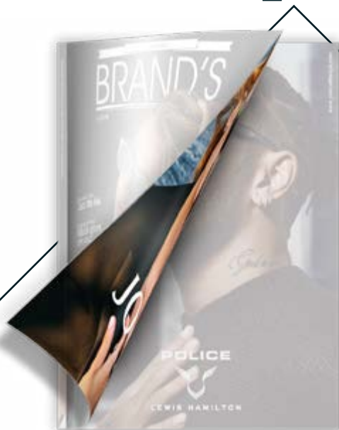
II di copertina BR 4