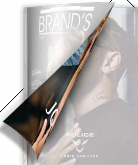
II di copertina BR 4