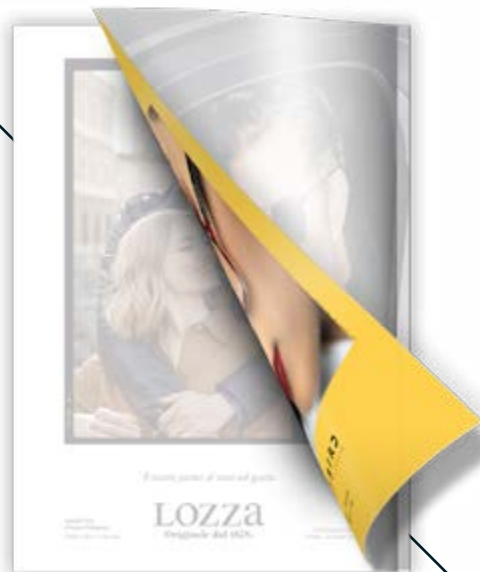
III di copertina BR 4