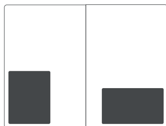
Pagina interna piccola SF 5