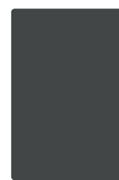
Pagina intera SF 3