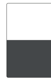
Mezza pagina in I di copertina SF 2B