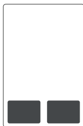
Manchette bassa in I di copertina SF 1