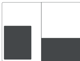
Pagina interna grande SF 4