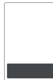
Piedino in I di copertina SF 2F